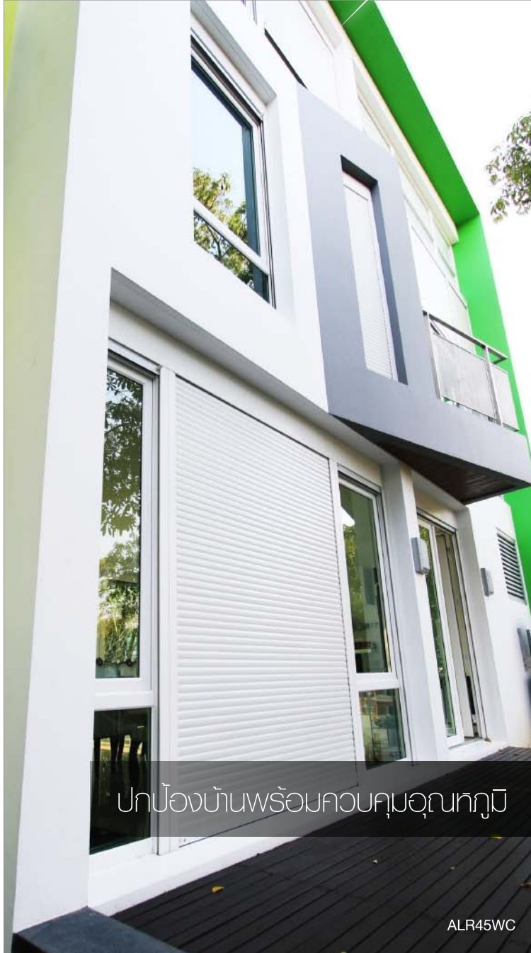
ปกป้องบ้านพร้อมควบคุมอุณหภูมิ